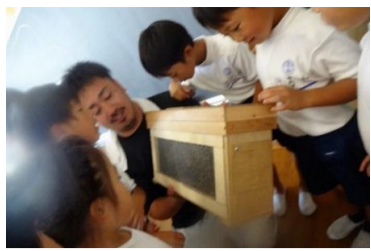
1-2 ミツバチ ～ぼくらはミツバチ探検隊～