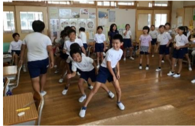
4-1 41 ダンサーズ！

白羽小学校区は、ひとつのコミュニティーです。 虫の鳴き声、お囃子の音色、強く吹く北風。窓を開けると様々な秋の音が 聴こえてきます。 過ごしやすいこの季節は、散歩やサイクリングも◎。 新しい御前崎の魅力を発見するチャンスかも？！ 夕暮れが日毎に早くなります。 地域の皆様、下校時の見守り、声掛け 薄暮時の安全運転をよろしくお願いいたします。