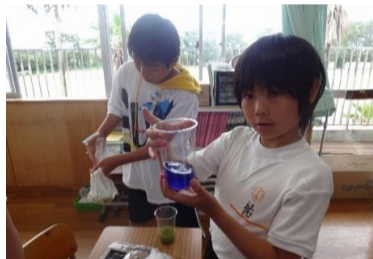
5-2 みんなで染めよう ～心に残る白小flag～