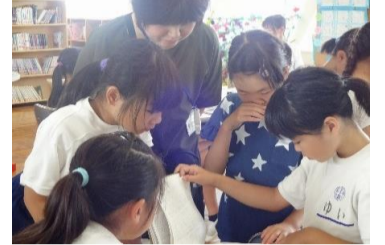
3-2 1からつくるだんご