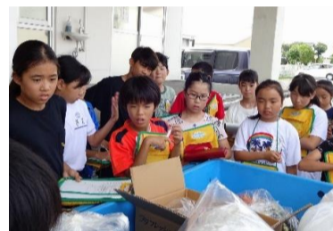
6-1 No Food Loss Project！