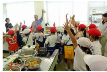
2-2 町たんけんへ行こう

生活・総合的な学習の時間 『はばたき学習』 白羽小学校では、各クラス が1年間を通し様々な取組を しています。児童が主体的に テーマを決め、方法や解決策 を考え、判断し、挑戦し、創 造し、学んでいます。