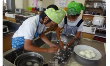
なかよし 『おべんとう★なかよし』から えがおをとどけよう

白羽小学校区は、ひとつのコミュニティーです。 虫の鳴き声、お囃子の音色、強く吹く北風。窓を開けると様々な秋の音が 聴こえてきます。 過ごしやすいこの季節は、散歩やサイクリングも◎。 新しい御前崎の魅力を発見するチャンスかも？！ 夕暮れが日毎に早くなります。 地域の皆様、下校時の見守り、声掛け 薄暮時の安全運転をよろしくお願いいたします。