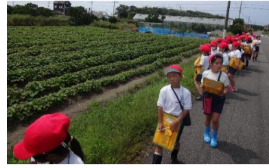
3-1 白羽の食材を使って オリジナルメニューを考えよう！

生活・総合的な学習の時間 『はばたき学習』 白羽小学校では、各クラス が1年間を通し様々な取組を しています。児童が主体的に テーマを決め、方法や解決策 を考え、判断し、挑戦し、創 造し、学んでいます。