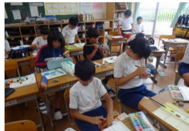
5-1 壁面 ～白羽の良さを絵で伝えよう！～

12/7(土)『浜の子発表会』 各クラスで取り組んできた 「はばたき学習」の成果を 発表します。子ども達は、この 日にむけて準備をし、練習を 積んでいます。 保護者や地域の皆様、たく さんの方の御来校を楽しみに お待ちしております。