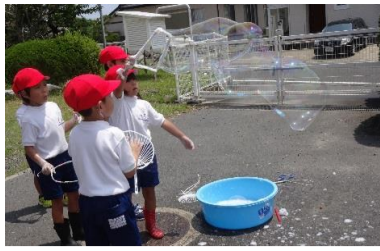
1-1 あそぼう！つたえよう！ ここにこたんけんたい