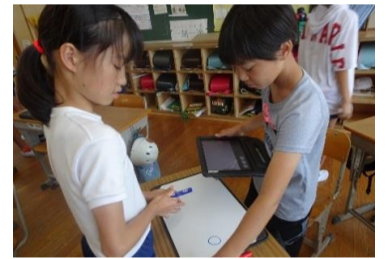
6-2 6-2コマ撮りスタジオ ～みんなの心を動かそう～