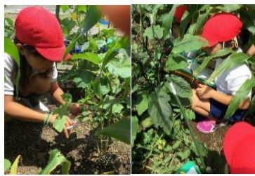
2-1 ぐんぐんそだて！夏やさい